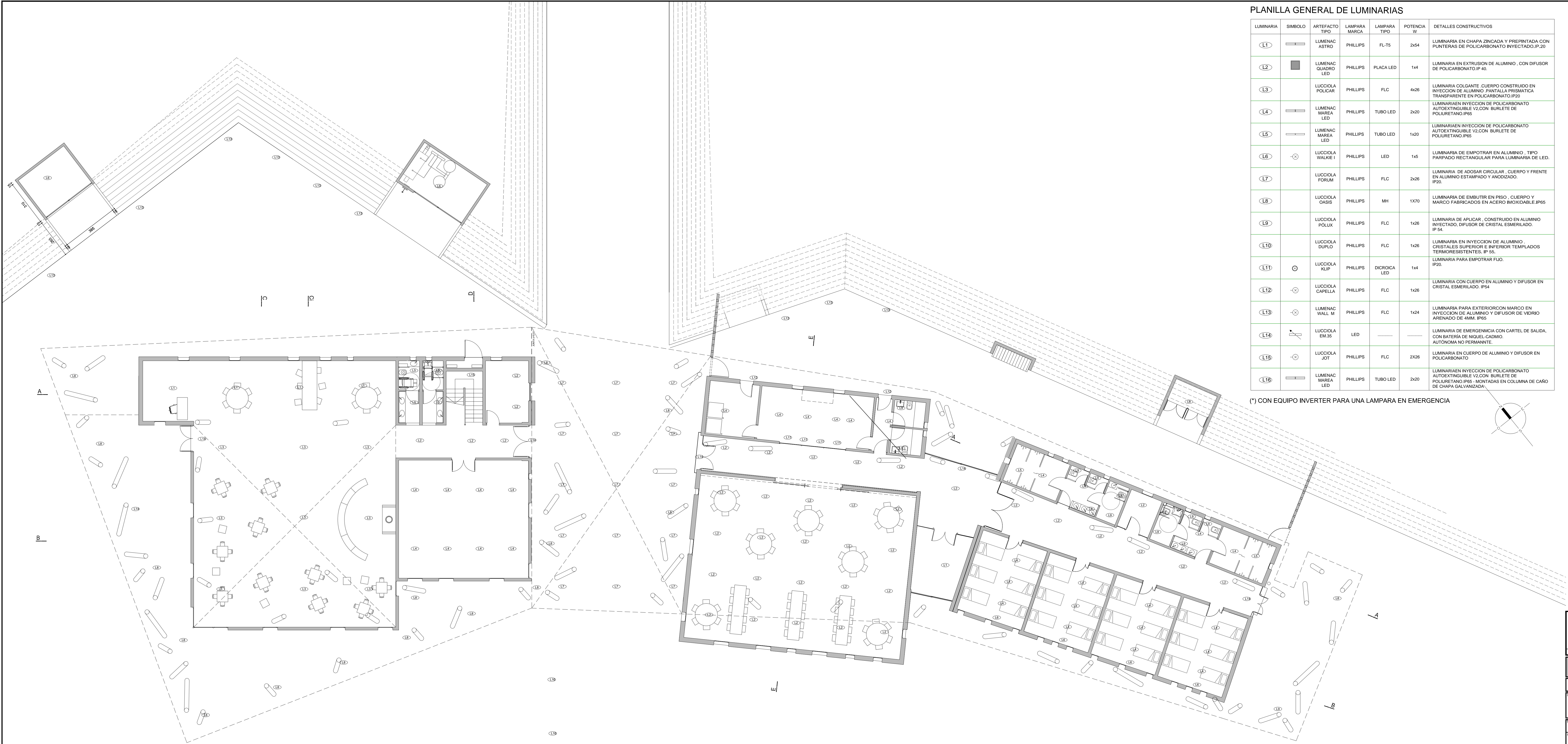
PLANILLA GENERAL DE LUMINARIAS